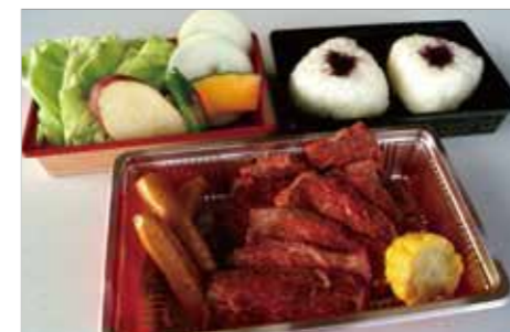
B バーベキューB 2,500円 (税別)