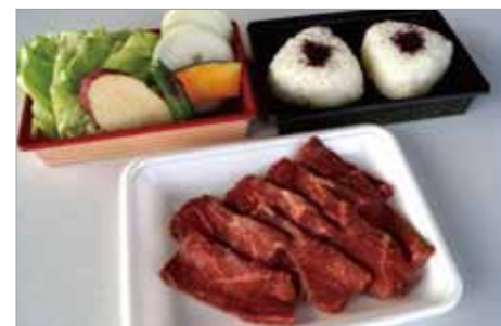
A バーベキューA 2,000円 (税別)