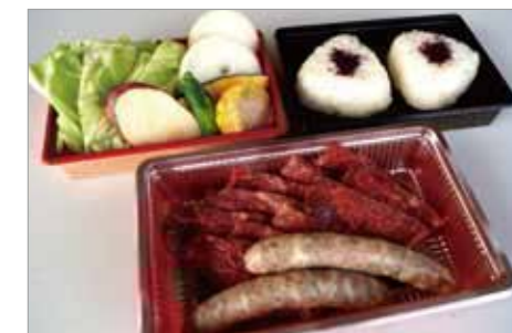
C バーベキューC 3,000円 (税別)