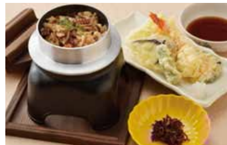
① 季節の釜飯御膳 1,200円 (税別)