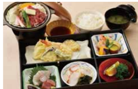
③ おのころ御膳 2,000円 (税別)