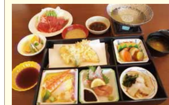
⑦ 淡路牛しゃぶ御膳 A 2,500円 (税別)