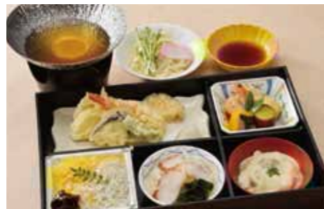
② 四季彩り御膳 1,500円 (税別)