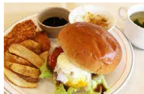
⑥ おのころバーガーセット 1,100円 (税別)