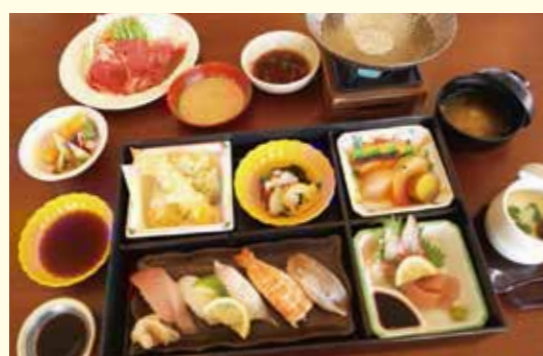
⑧ 淡路牛しゃぶ御膳 B 3,000円 (税別)