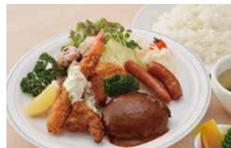
④ ハンバーグプレート 1,500円 (税別)